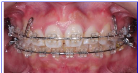
マルチブラケットによる治療写真