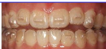
アタッチメント+マウスピース

左側の写真のようにマルチブラケットによる治療からアライナー系（インビザ）による治療へと時代は変化してきました。