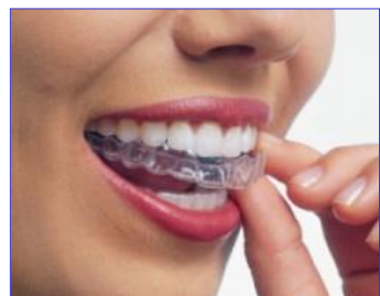
アライナー系 (インビザ) による治療写真