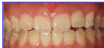
アタッチメントを付けた歯